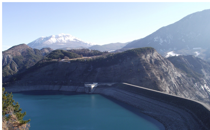
Barrage de Serre-ponçon